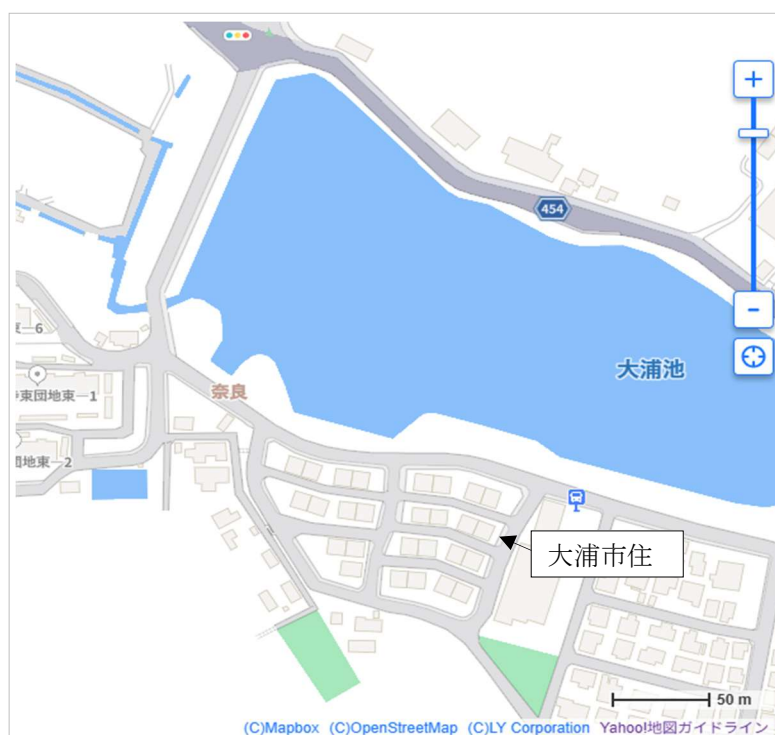
市営住宅配置図(募集団地用)

※市営住宅の配置図と詳細な間取り図は弊社の HP http://www.jkk.ecnet.jp/ または、こちらの QR コードから御覧いただけます。